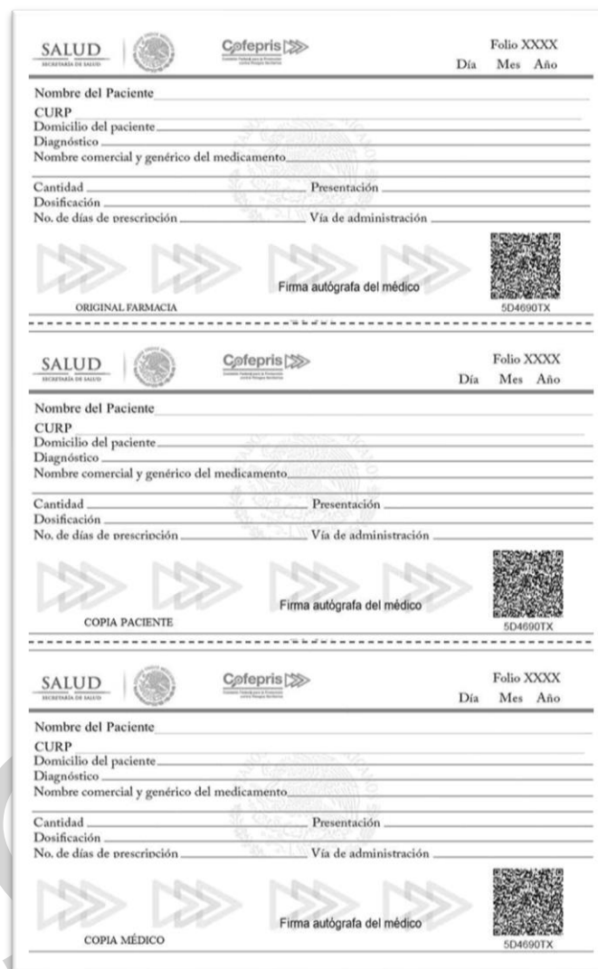
Figura 2. Formato del recetario electrónico especial para prescripción de estupefacientes tramitado de forma electrónica.

“2024, Año de Felipe Carrillo Puerto, benemérito del proletariado, revolucionario y defensor del Mayab”